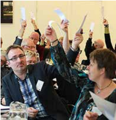
Kun de delegerede kan stemme på repræsentantskabsmødet.