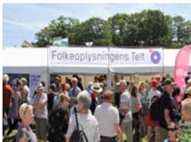
Folkeoplysnings Telt på Folkemødet på Bornholm

Facebook-siden Folkeoplysningen fik et markant løft via "Folkeoplysning - du lærer mere, end du tror" kampagnen.